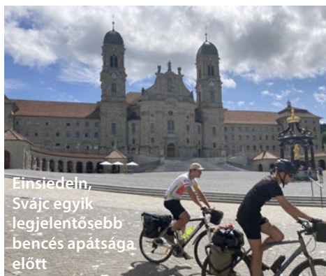
Einsiedeln, Svájc egyik legjelentősebb bencés apátsága előtt

Genfben töltöttük az utolsó svájci éjszánkát. Itt még tudtuk németül beszélni ▶