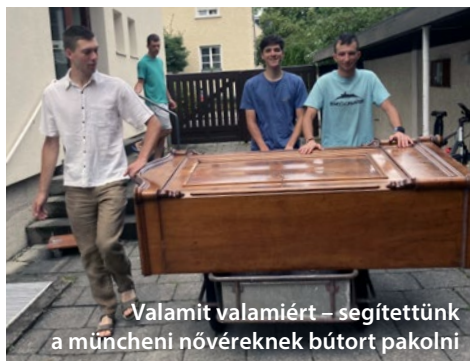
Valamit valamiért – segítettünk a müncheni nővéreknek bútort pakolni

A Sankt Ottilien bencés apátság nincs messze Münchentől, emiatt ráérősen tekerünk ki következő szálláshelyünkre. Idáig kísérőautó nélkül tekerünk, itt azonban beért minket az autós kísérőnk, akivel együtt haladtunk tovább. Csodás tájakon