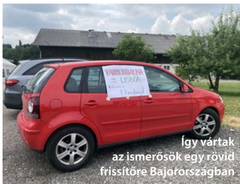
Így vártak az ismerősök egy rövid frissítőre Bajorországban

Reggel 5:00-ra van kitűzve az indulás. Círil pannonhalmi főapát úr is ott van hajnalban a főapátság kapuja előtt. Úti áldásban részesít minket, majd elindulunk. Olyan érzés, mintha csak Győrbe tekernénk, vagy valamelyik szomszédos kisvárosba. Talán még mi sem hittük el, hogy azt a Lisszabont tűztük ki célul, amit 4092 kilométernyi kaland során értünk el. Győrben hamar ott voltunk, majd gyors fotóra megkértük az egyik járókelőt, aki megmosolygott minket érdekes vállalásunk hallatán.