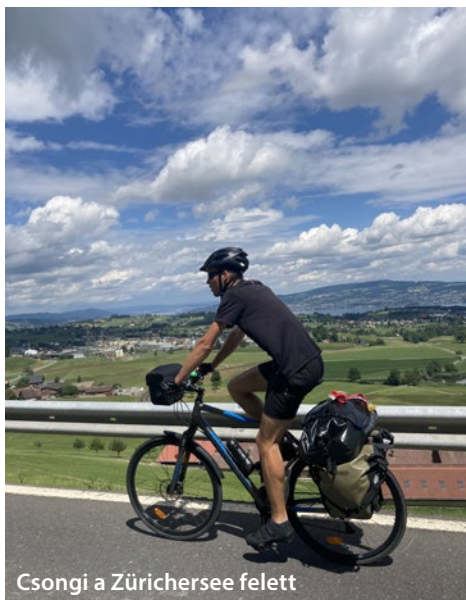
Csongi a Zürichersee felett

Valószínűleg ezeken rágódtunk volna egész éjszaka, ha vacsora és a bencésekkel való közös imádság után nem nyom el bennünket az álom. Következő nap valóban úgy indultunk el, hogy nem tudjuk, hol fogunk aludni, érkezésünk előtt azonban ismerős ismerősén keresztül mégiscsak lett helyünk. Itt még azért nagyon közel vagyunk a hazához. Sok távsegítséget kapunk otthonról.