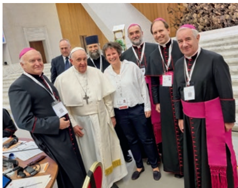
Ferenc pápa a zsinódus magyar résztvevőivel

Mindenképp fontos lenne, hogy a zsinati dokumentum egyes pontjairól elmélkedjünk, beszélgessünk, ezáltal is részt vállalva az Egyház nagy közös gondolkodásából. „Engedjük, hogy jó értelemben provokáljanak és elgondolkodtassanak bennünket azok a témák, amelyeket a Szentlélek kézzelfog-