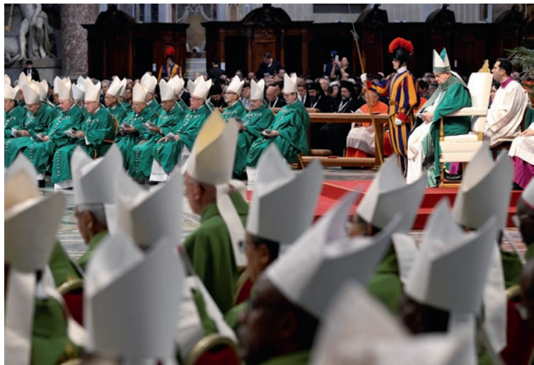
A zsinódus zárómiséje a Szent Péter-bazilikában 2023. október 29-én

Természetesen a zsinat szintézisében megjelenik minden olyan kérdés, amely