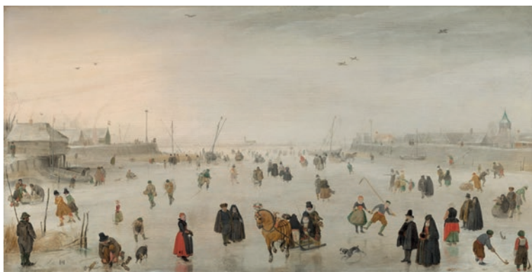
Hendrick Avercamp: Ice scene (1610 körül)