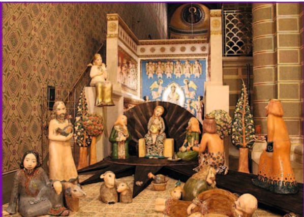
▲ 2016 karácsonya előtt mutatták be a pécsi székesegyházban Ágoston-Papp Mónika keramikuművész nagyméretű betlehemi kompozícióját