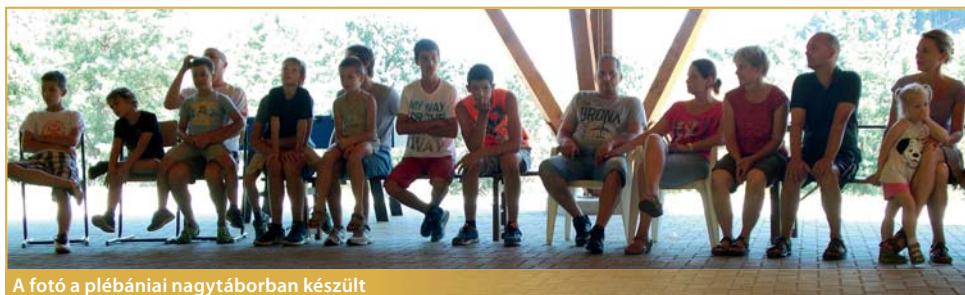
A fotó a plébániai nagytáborban készült