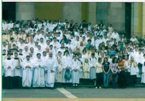
Nemzetközi ministráns találkozó Rómában 2015. augusztus 3-8.

A találkozón a magyar ministránsok létszámukat tekintve az elsők között vol- tak. Minden magyar egyházmegye képvise- ltette magát az örök városban, sőt még a határon túli magyarok is bekapcsolódtak a szervezésbe. Én a pannonhalmi egyházme- gyével mentem, csoportunkat a pannon- halmi bencés gimnázium és a győri bencés