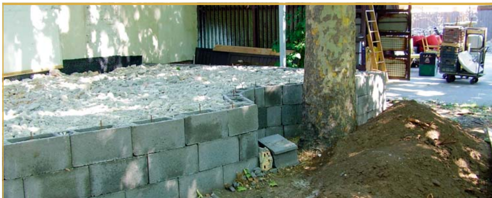
A „platános terasz”

► terasz alapozási munkái. Az alap kitűzésénél kiderült, hogy a terasz külső szélét egy öreg platánfa törzse érinti. Rövid tanácskozás után olyan döntés született, hogy a fát belülről kerüljük meg, a teraszból, mint egy 1 m 2 -es darabot kivéve. Szerencsére a fa fontosabb gyökerei nem keresztezték az alap útját, így elkerülhető volt a terasz nagyobb méretű csökkentése. Ha a kultúrház helyiségei valamilyen nevet kapnának, akkor javasolt a teraszt „platános teraszra” keresztelni. Elkészült a mozgássérült-feljáró rámpa oldalfalának betonozása, és beépültek a műanyag nyílászárók is.