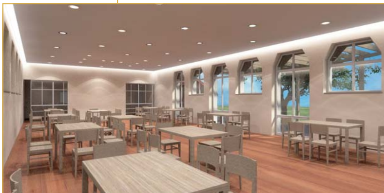
Tényleg ilyen jól fog kinézni? (Ez még csak egy látványterv...)

Talán mindenki emlékezetében él még a Don Bosco közelmúltja, amikor fűthetetlen volt, ki volt téve a természet viszontagsá-gainak, és csak héba-hóba használta vala-ki. Ahhoz, hogy az előreláthatóan gyönyörű épület és bútortartat generációkat tudjon szolgálni, közös összefogásra van szükség, nemcsak anyagi tekintetben, hanem sokkal inkább a lelkeket megérintő ötletek, programok terén, amelyek megadhatják azt a hozzáadott értéket, ami miatt érdemes volt