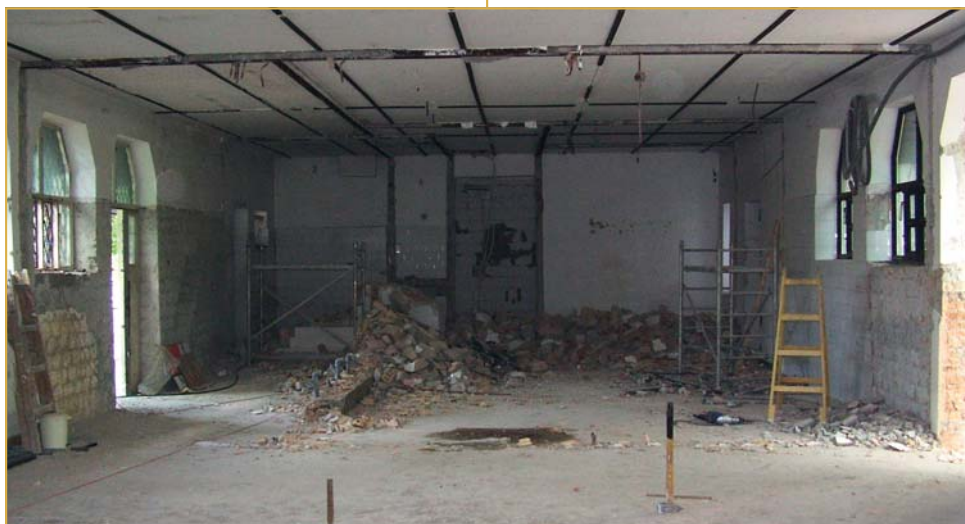
No, ennél már lényegesen jobban állunk...

Az első ütemben elkészült a főbejárat melletti vizesblokk. A második ütemben az épület egy részében működő kis köztet kellett az épület hátsó részébe költöztetni, majd ezt követően kezdődhetek a bontási munkák. Kibontották az összes válaszfalat és a burkolatot – bámulatos gyorsasággal –, majd elkezdődtek a külső