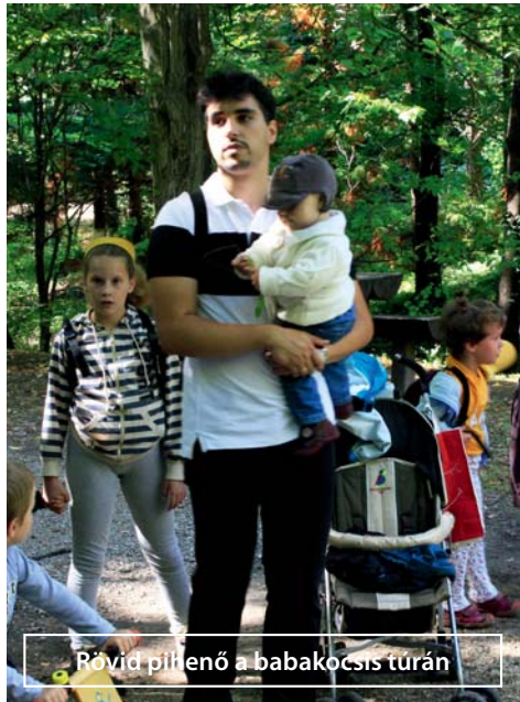
Rövid pillenő a babakocsis túrán