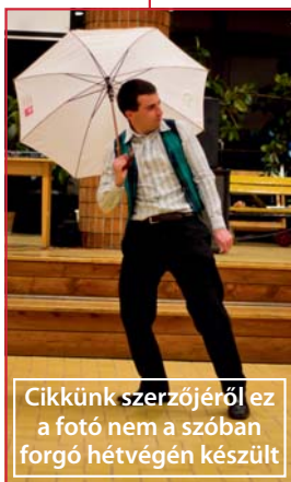
Cikkünk szerzőjéről ez a fotó nem a szóban forgó hétvégén készült