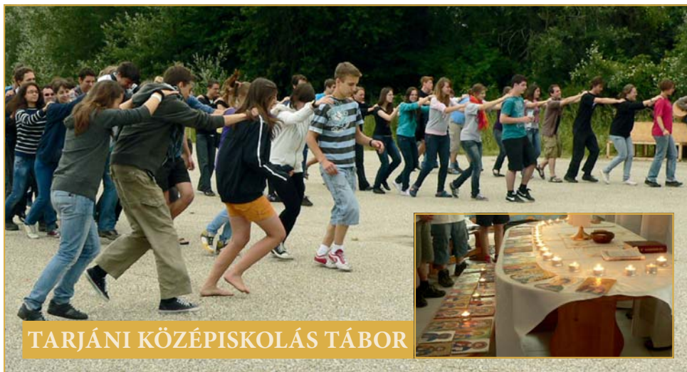
TARJÁNI KÖZÉPISKOLÁS TÁBOR

Az idei tábor se múlhatott el felejthetetlen élmények és nevetések tömkelege nélkül.